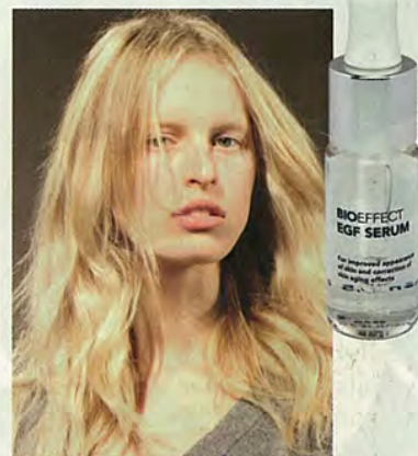
Page réalisée par Frédérique Verley et Lili Barbéry-Coulon.

Lancé en Islande en mai dernier, ce sérum serait déjà utilisé par 20% de la population! C'est le premier soin utilisant un ACTIVATEUR CELLULAIRE à base d'orge, capable de relancer la régénération de tout l'appareil cutané. Cet activateur cellulaire est en plus obtenu par biotechnologie verte, cultivé dans la cendre volcanique et arrosé d'eau printanière pure. Bioeffect EGF Sérum, 135 €, chez Colette.